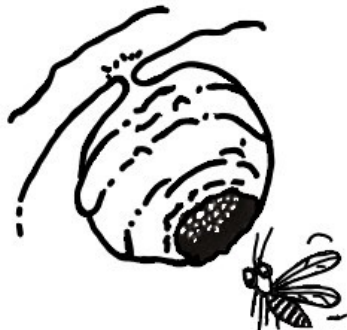
... vlétá do vosího hnízda.