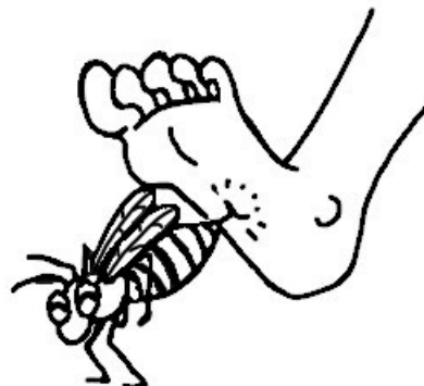
... píchla Vaška do nohy.