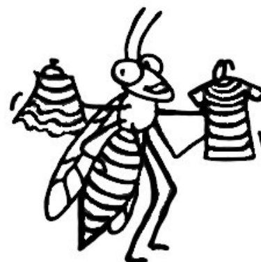
... je pruhovaná.