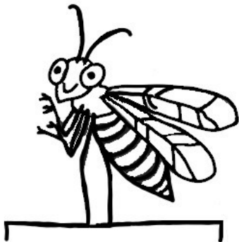
... vyletěla na dveře.

Podle níže uvedených obrázků vyprávějte, co může vosa dělat. Používejte celé věty.