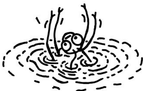
... se topí ve vodě.