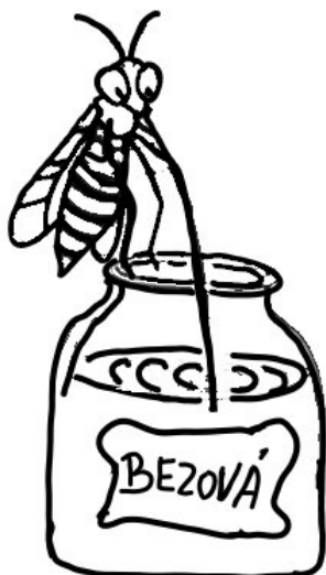
... vypila bezovou šťávu.