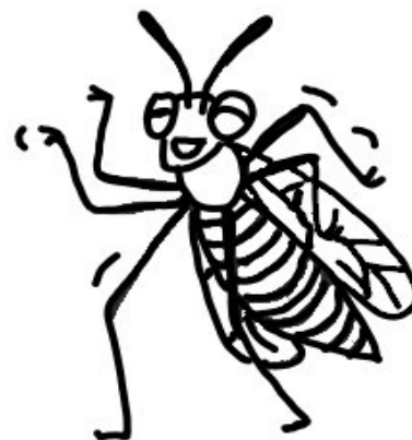
... tančí vosí tanec.